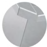
Myke overganger på alle utvendige vinkler