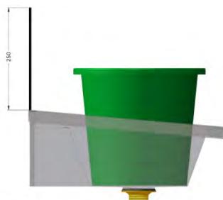
Plass til oppvaskbøtte