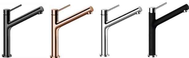
Vare nr. 510000GOM

Alle vores armaturer lagerføres på vores lager i Køge, og kan leveres dag-til-dag.