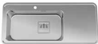
EL114SXRF Disklåda höger, RSK 8020287 – GTIN 7393069019018 EL114SXLF Disklåda vänster, RSK 8020288 – GTIN 7393069019025