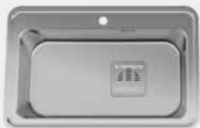
EL78SXF EL78SXF, RSK 8020286 – GTIN 7393069019001