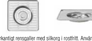
Fyrkantigt rengaller med silkorg i rostfritt. Används till till Frame diskbank med upplyftsventil.