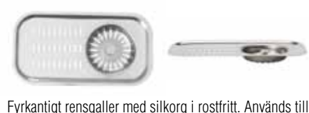
Fyrkantigt rengaller med silkorg i rostfritt. Används till Eureka diskbank med upplyftsventil.