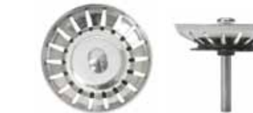
Silkorg med centrumpinne i rostfritt utan kula.