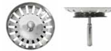
Silkorg med centrumpinne och ställbar sexkantsskruv i rostfritt.