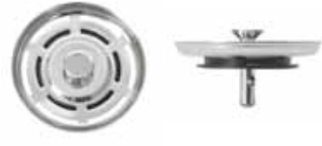
Silkorg med centrumpinne i rostfritt med centrerad kula.