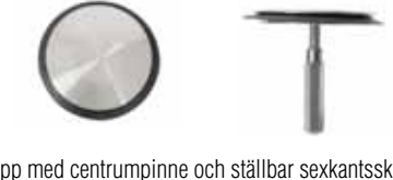
Propp med centrumpinne och ställbar sexkantsskruv i rostfritt.