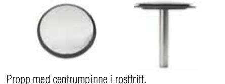
Propp med centrumpinne i rostfritt.