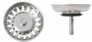
Silkorg med centrumpinne i rostfritt med kula ej centrerad. Kula närmre övre del av silkorg.