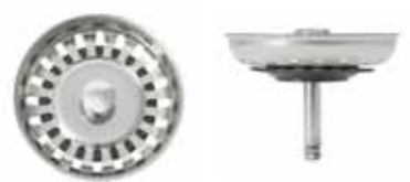
Silkorg med centrumpinne i rostfritt med ställskruv och låsmutter.