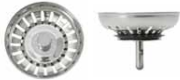
Silkorg med centrumpinne i rostfritt med centrerad kula. No.008445 instansat i silkorg.