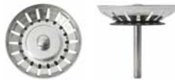
Silkorg med centrumpinne i rostfritt utan kula.