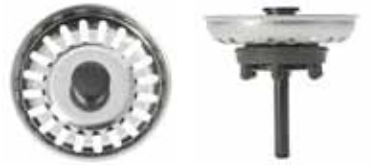
Silkorg i rostfritt med svart lyft knapp och centrumpinne i plast. 6 alt. 8 st nabbar i gummi på undersidan.