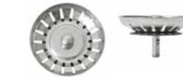
Silkorg med centrumpinne i rostfritt med kula ej centrerad. Kula närmre övre del av silkorg.