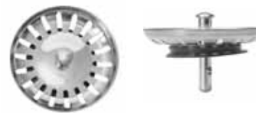
Silkorg med centrumpinne i rostfritt med centrerad kula.