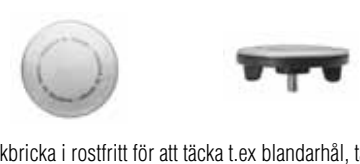
Täckbricka i rostfritt för att täcka t.ex blandarhål, täcker max hål Ø38 mm.