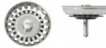
Silkorg med centrumpinne i rostfritt med kula, ej centrerad. Kula närmre övre del av silkorg.