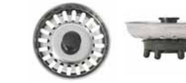
Silkorg i rostfritt med svart lyft knapp i plast. 6 alt. 8 st nabbar i gummi på undersidan.