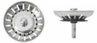
Silkorg med centrumpinne i rostfritt med centrerad kula.