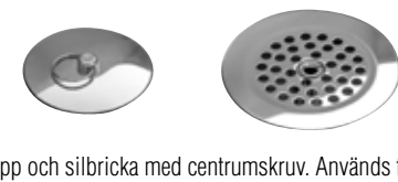
Propp och silbricka med centrumskruv. Används för utbyte av en manuell korgventil till propp i Prevex ventilet.