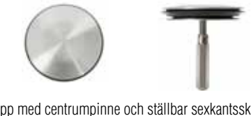
Propp med centrumpinne och ställbar sexkantsskruv i rostfritt. No.C6237 instansat på undersidan. Påse innehåller även en styck Silkorg utan pinne. No.009217 instansat i silkorg.