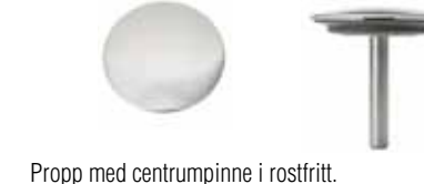
Propp med centrumpinne i rostfritt.