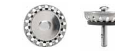
Silkorg med centrumpinne i rostfritt med centrerad kula.