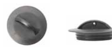
Propp i gummi. Används till Atlantic diskbank.