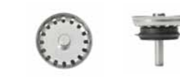
Silkorg med centrumpinne i rostfritt med centrerad kula.